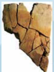
「无射志国在原評」銘文字瓦