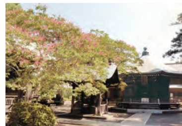
▲ガイド部で案内する影向寺のサルスベリと太子堂

市民に向けて高津区のモデルコースの史跡等を案内する中で配慮していることがあります。①公に使うことのできるトイレの確認と清潔な使用 ②土日は、交通機関や見学先がとても混雑するので、平日に実施 ③年齢構成等を考慮しながら、前・中・後にガイドを配置して、参加者の安全を守る工夫 ④神社仏閣への事前連絡（入ってはいけない場所・触ったり移動したりしないこと・撮影禁止の確認）等です。