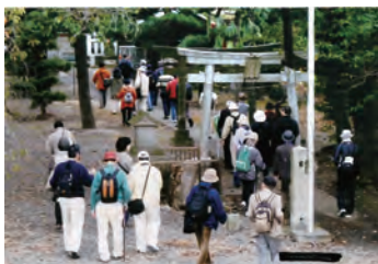
▲毎月第4木曜日の散策例会

散策部は、毎月第4木曜日（雨天の場合は翌月第2木曜）に例会を開催し、自主研修を深めています。散策部の部長さんは、同会の最高齢で86歳、毎月の散策例会の先頭で活動しています。