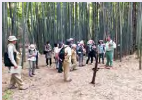
▲『かわさきそだち』を楽しもう講座風景

10/24～12/5(月) 13:00～ 終了時間は、回によって変わります。計5回 受講料 4,110円 定員30名