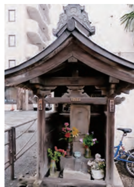
▲大山街道高津区片町の庚申塔