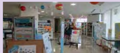
▲展示・体験コーナー

CCかわさき交流コーナーには、展示コーナーや体験コーナーが設置されています。ペダルをこぐと前にある電球が点灯する自転車発電体験コーナーでは、発電にチャレンジすることができます。また、毎月テーマを設けて展示物を変えています。5月は、水がテーマで水に関係する本等の資料を紹介していました。