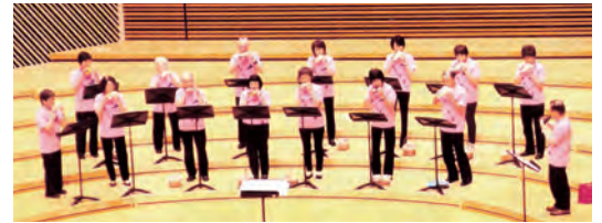
▲ユニホームでシニア音楽祭に参加

2013(平成25)年10月には、市制90周年プレイベントとして行われた「シニア