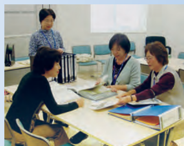
▲生涯学習相談ルームの様子