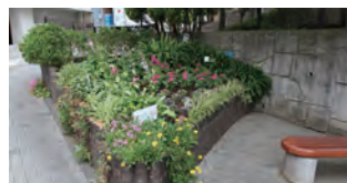
▲ベンチのあるポケットパーク

宮前平駅から宮前市民館へ行く富士見坂の途中にある「ポケットパーク」は、倶楽部発祥の地となっており、第4回コンクールでは、なごみ賞を受賞しました。