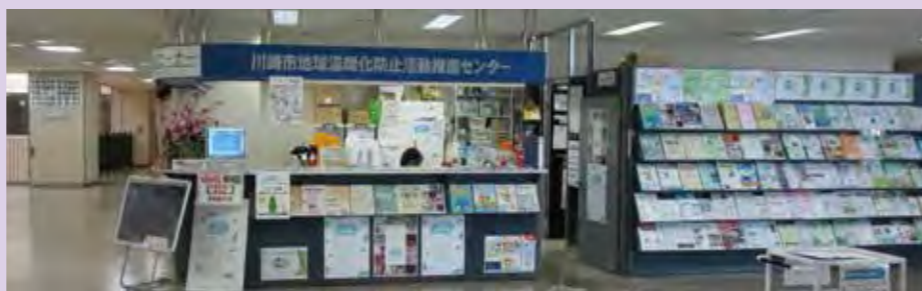
▲「川崎市地球温暖化防止活動推進センター」(CCかわさき交流コーナー)