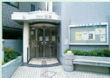
▲田島分館(プラザ田島)入口