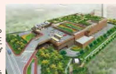
▲環境館と資源処理施設

王禅寺処理センター内に「王禅寺エコ暮らし環境館(以下「環境館」と略します)」と「王禅寺処理センター資源化処理施設」がオープンしました。