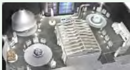
▲2階 展示室チャレンジゾーン

2階展示室は、地球温暖化・再生可能エネルギー・資源循環の3つのチャレンジゾーンがあります。地球温暖化のゾーンには、「川崎の暮らし環境100年アルバム」があり、①昔の川崎の自然 ②いろいろな会社を呼んできた ③伸び行く川崎 ④公害を乗り越えて ⑤よみがえる川崎の自然 ⑥未来をひらく環境力等、写真だけでなく当時のビデオ映像を観ながら、歴史をふりかえり、これからの川崎の環境について考えることができます。