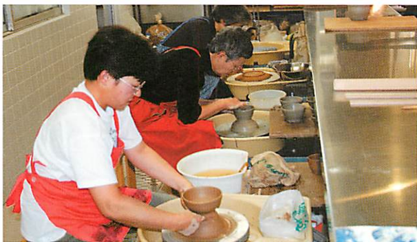
心静かに作品と向き合う