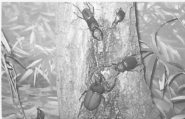
樹液に集まる昆虫(展示室シオラマ)

夏 青葉がさらに青くなり、蛍が飛び交うと夏です。夏はなんといっても昆虫観察会の季節といえるでしょう。クヌギなどの樹液にこども達に人気のあるカブトムシ、ノコギリクワガタ、コクワガタをはじめカナブン、クロカナブン、キタテハなどが集まってきます。でもオオスズメバチもやってきますので注意が必要です。