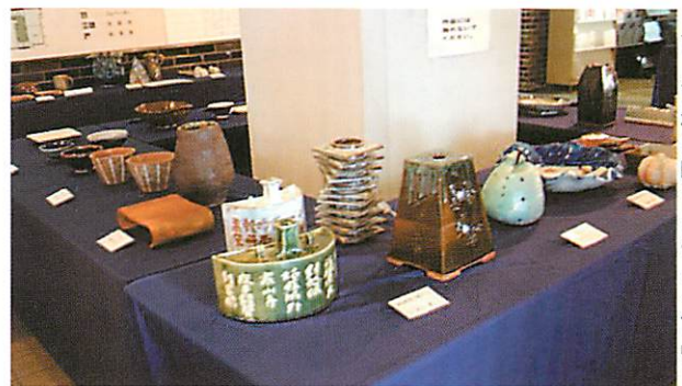
百人百様の味わいのある作品