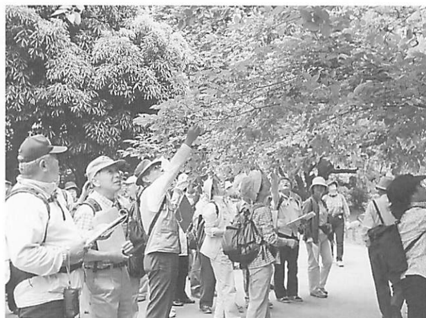
野外で学ぶ「みどり学」の受講生 日比谷公園で樹木ウォッチング

今年アカデミー設立10周年にあたるということで、特別な課題研究にみんなで取り組んでいます。減速気味の読書力にネジを巻きながら、ゆっくりとエンジン加速中です。