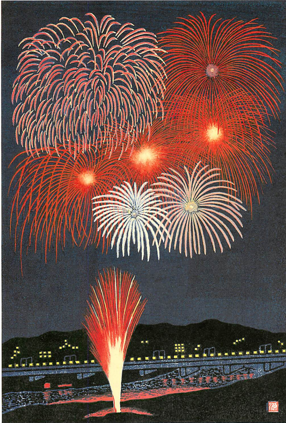
「多摩川の花火」 版画：浪江 年博

発行・(財)川崎市生涯学習振興事業団 〈ホームページ〉 http://www.kpal.or.jp