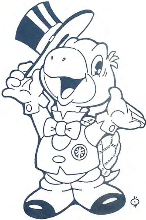
かわしんマスコット タットちゃん

暮らしの中で、ビジネスで いつもお役に立ちたい。 かわしん は皆様の毎日に 大きな信頼でお応えします。