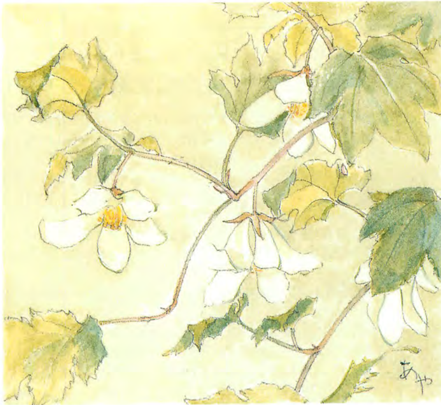
王禅寺のモミジいちごの花