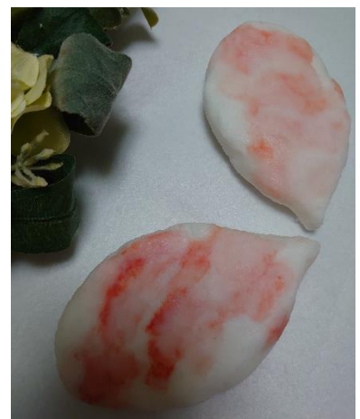
〈桜のマーブルコネコネ石けん〉