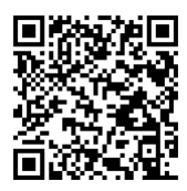
↑ 申込フォームのQRコード