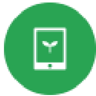
【オクリンクプラス】(授業支援) 【ドリルパーク】(個別学習)