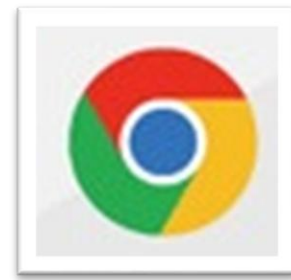
Google クローム (Webブラウザ)