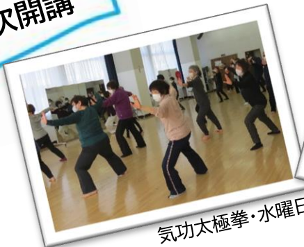
気功太極拳・水曜日