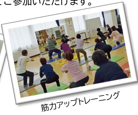
筋力アップトレーニング