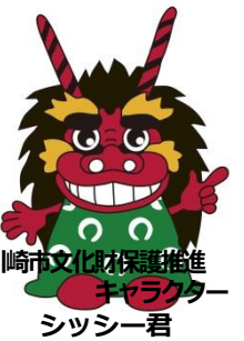
川崎市文化財保護推進キャラクター シッシー君