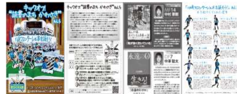
『キックオフ! 読書のまち かわさき』vol.5

今年のリーフレットは、選手が帯コメントで オススメ本を紹介しますが、それを見て本を読 んだ人からも帯コメントを募集します。応募さ れた帯コメントの中から選手が大賞を選考し、 受賞者をホームゲームに招待して、試合前にオ ーロラビジョンを使った授賞式を行います。