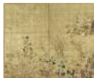
秋草図屏風 尾形光琳筆

受け継がれた文化財 「川崎大師の寺宝と信仰」 「文化財は語る…」 4/20(土)～6/2(日) 観覧料：一般 800 円 学生・65 歳以上 600 円