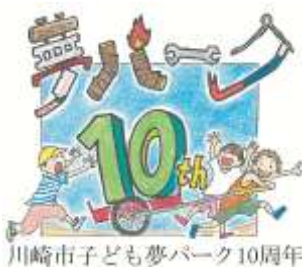
川崎市子ども夢パーク10周年

発(公財)川崎市生涯学習財団 〒211-0064 川崎市中原区今井南町514-1 川崎市生涯学習プラザ内