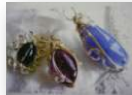
アートジュエリー

井上ひさし作「水の手紙」の群読、シネマカフェ&トーク「宮城からの報告」、こども理科教室、アートジュエリーづくり、油絵・切り絵作品の展示、中原区文化協会のブース、フリーマーケットなど。