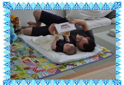
前回のイクメン賞「オトコ同士」