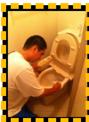
前回のカジダン賞「運気をもたらす人」