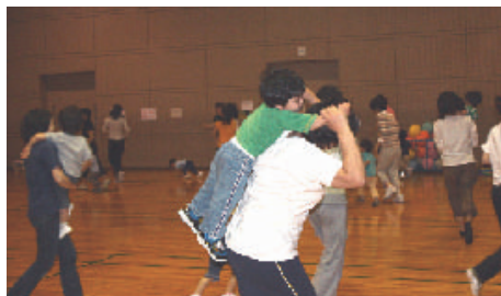
親子 スポーツ 教室