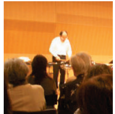
09年度前期ワークショップ「音楽」(ミューザ川崎に於いて)

(WS-6) など、多くの講座を実施します。この秋、新しい学びに挑戦してみませんか。