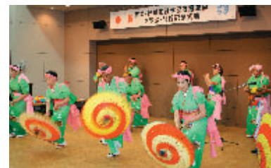
柿落とし「ひがさ他」