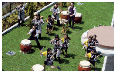
和太鼓による記念演奏