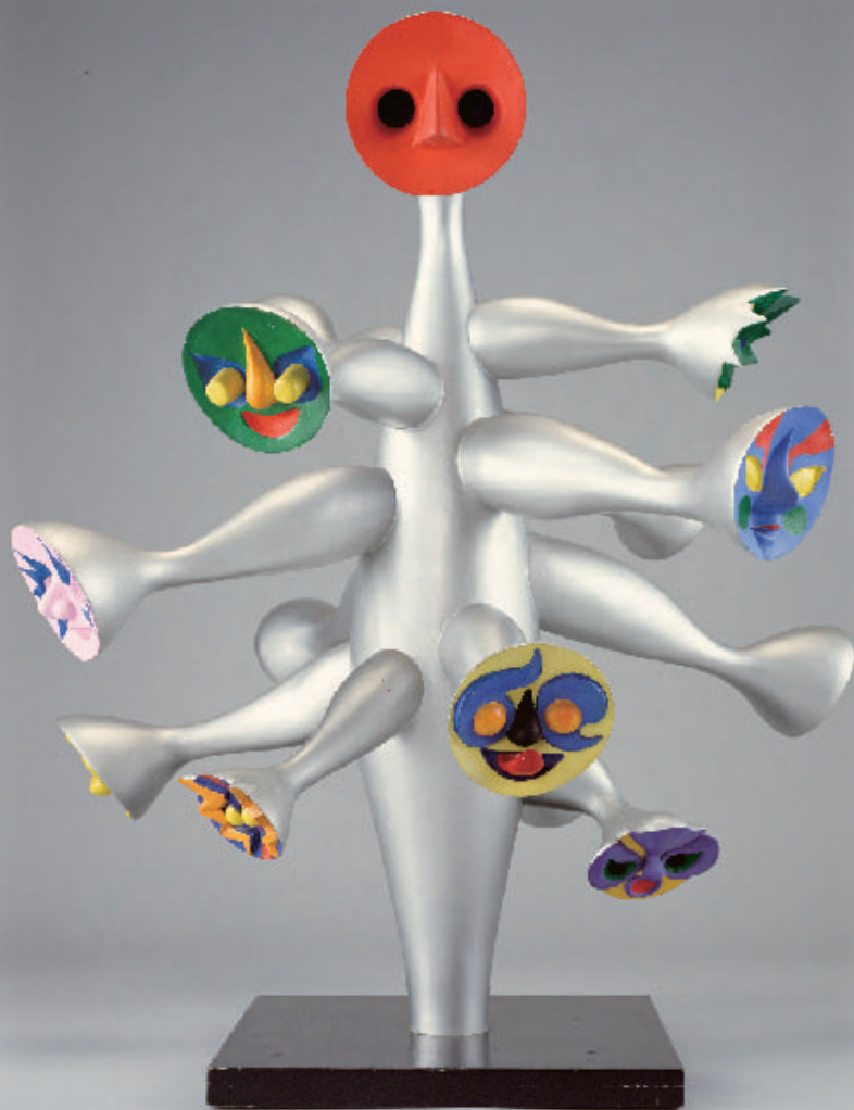
岡本太郎 「こどもの樹」1985年（繊維強化プラスチック） 川崎市岡本太郎美術館蔵