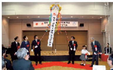
記念のくす玉割り