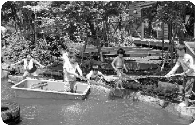
せせらぎ広場で遊ぶ子どもたち