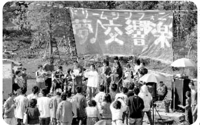
飛び入り参加ありで大盛況の「野外コンサート」