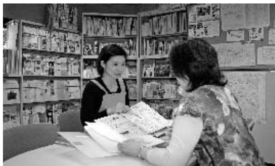
講座探しのお手伝いをしています

最近運動不足だという中年の女性が「あまりきつくない運動をしたい」とのこと。いくつかの「健康体操」のグループを紹介。(数日後、その方から入会することにしたとの報告があった)