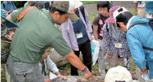
野外で学ぶ「ボランティア」の受講生

「かわさき市民アカデミー」は、活力ある地域社会の創造をめざす市民のための学習機会を提供しています。市民の主体的な学習を援助し、市民自治の発展につなげていくことを目的として1993年の創設以来、他に類のない多彩な講座を開設してきました。今年度前期までの受講者数は延べ約4万人にのぼります。後期も、時代の動向やみなさんのニーズに応えた講座を実施します。また一昨年から導入された、市民が企画・運営する「ワークショップ」は、深く掘りさげ双方向に学びあえる場として定着してきました。この秋、一步踏み出し、新しい学びに挑戦してみませんか。