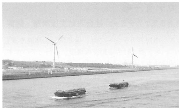
フィールドへ出て視野を広げる (東京湾の風力発電を見学)

フィールドワークがあるのもこの講座の特徴です。前期は、東京湾の埋立地に埋立処分場と風力発電の風車を見学に行きました。後期は、1泊で研修があり、地域ぐるみの環境活動が実践されている長野県飯田市を訪問し、環境マネジメントシステムについて学習してきました。