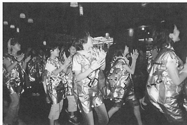
「富士見OKKOH(オッコ)まつり」で踊るサマーキャンプに参加した子どもたち

長野県富士見町コースでは、7月31日、地元富士見町の「富士見OKKOH(オッコ)まつり」に41名の子どもたちとスタッフが参加しました。