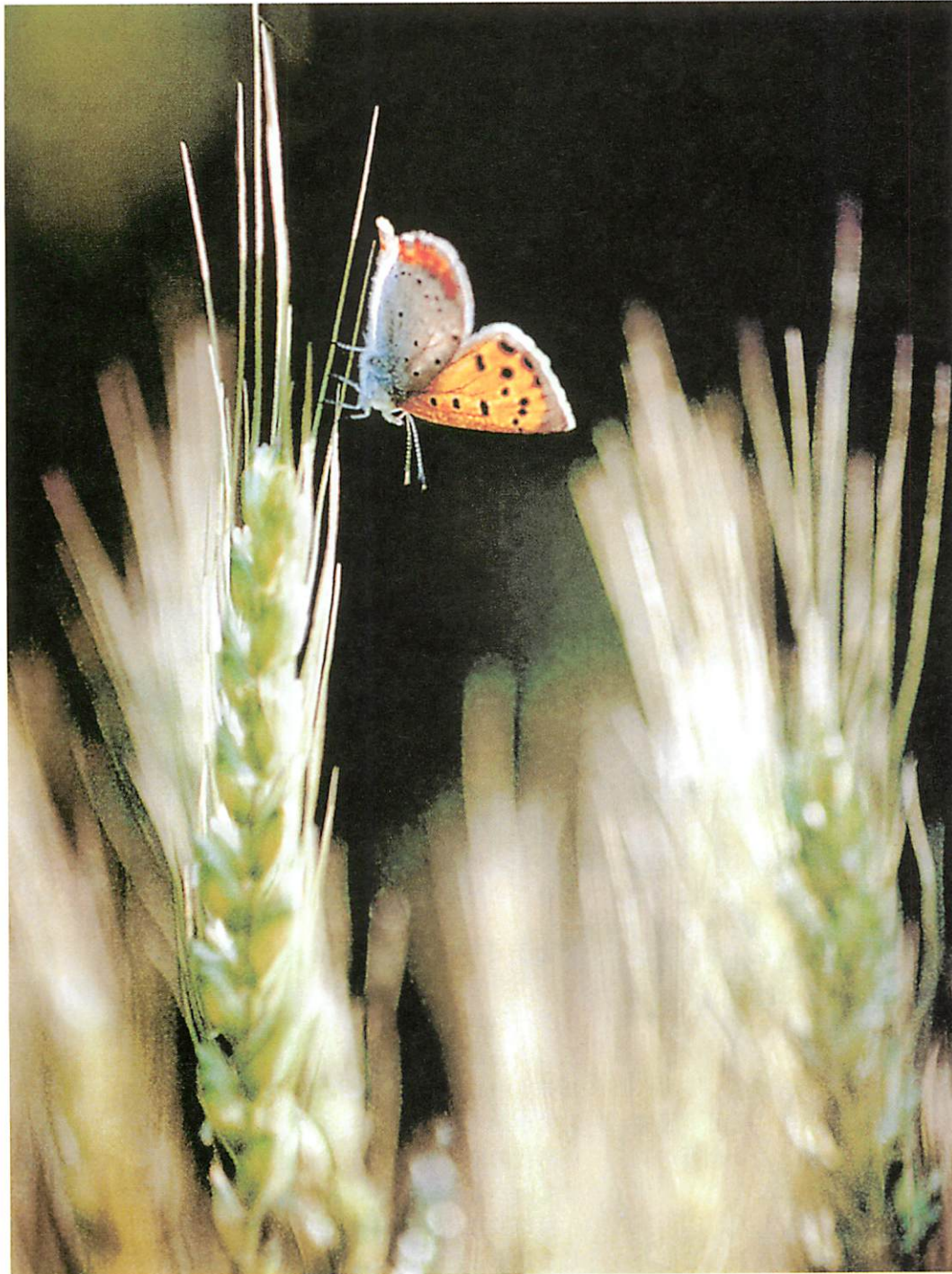
「青い麦穂の頃」(ベニシジミ)