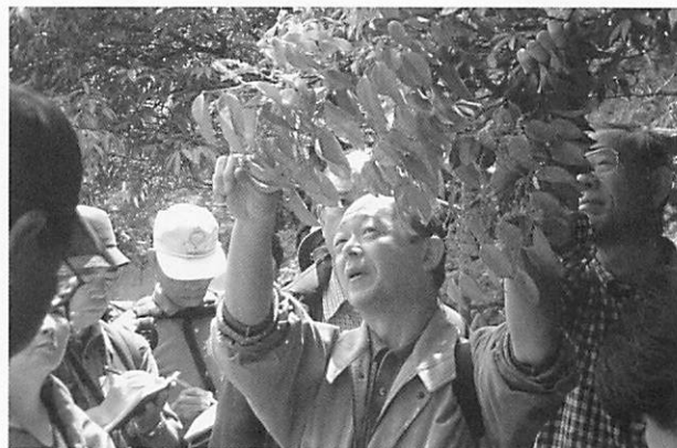
野外で学ぶ「川崎学Ⅳ」の受講生

また、友の会クラス委員や市民フロンティアのボランティア活動、グループ活動(句の会)などにも積極的に