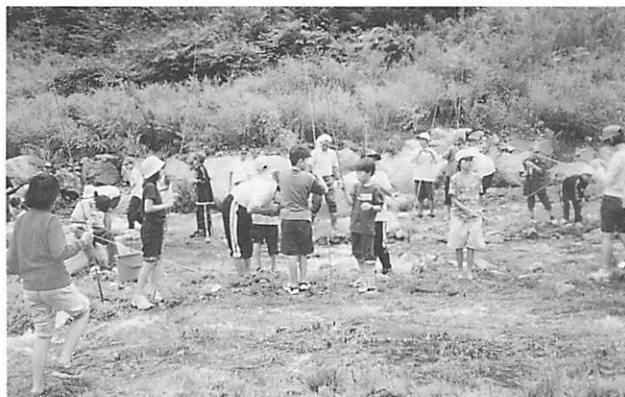
八ヶ岳で溪流釣りを楽しむ

青少年教育施設では、子どもたちが体験学習や集団活動を通して生きる力を培うとともに、心身ともに活力ある青少年の育成を目指しさまざまな事業を行っています。