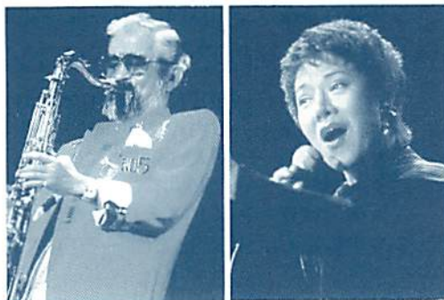
日本のジャズ界をリードしてきたテナーサクソフーン・松本英彦と 世界的なボーカリスト・伊藤君子によるスペシャルジャズ!