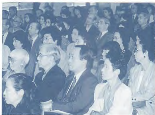
記念講演を熱心に聴き入る第一期生ら。

たとえば、高齢者が「戦争中は、お米がなかった」と生活が苦しかったころの話をする、今の子どもは「どうしてパンを食べなかったの」と不思議がります。飢えについて、想像ができません。それと同じように、今の四十年代