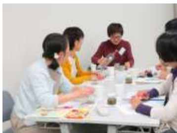
実習でのチンキ作り

会場 川崎市生涯学習プラザ2階会議室 受講料 4,500円 教材費 4,000円 (全5回分 消費税込)