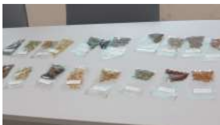
いろいろなハーブ