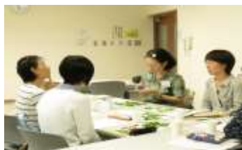
料理用フレッシュハーブ